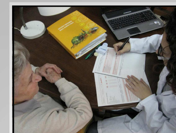
Intervención dietética y medidas antropométricas